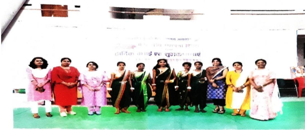
लोकनृत्य (समूह नृत्य)