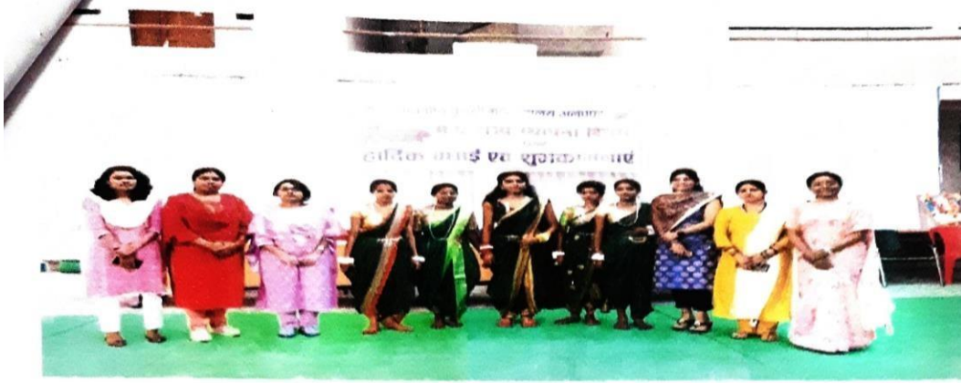
लोकनृत्य (समूह नृत्य)